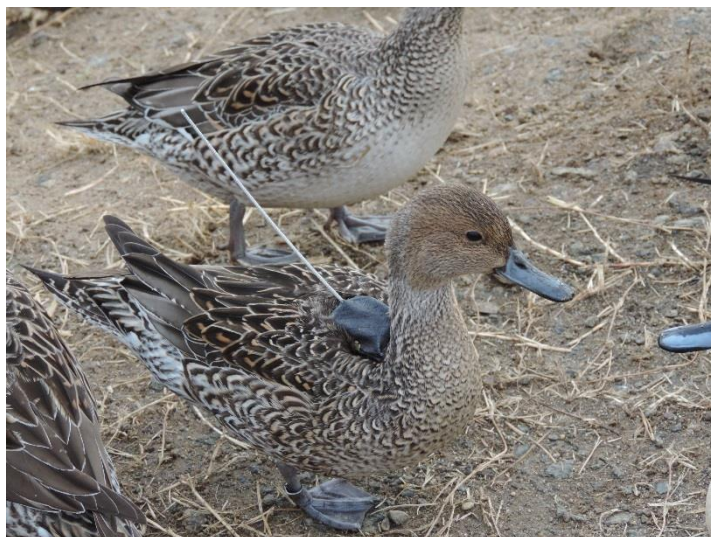
オナガガモに装着された送信機