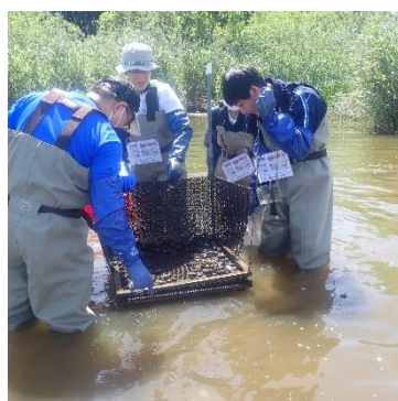
産卵された産卵床を発見