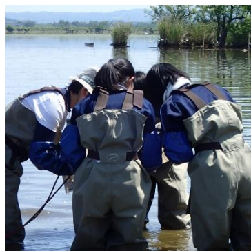
人工産卵床を確認中

本年度2回目のバス・バスターズは、第1回に続き天候に恵まれた中で行われました。例年よりも水位が30cmほど低く、小、中学生のお子様も楽しんでいました。栗原市内の岩ヶ崎高校、築館高校の皆さんをはじめ24名の皆様がボランティアとして参加いただきありがとうございます。人工産卵床では2カ所でブラックバスの産卵が確認されました。ブラックバスの稚魚は、前回に引き続き捕獲されませんでした。また、定置網ではライギョをはじめナマズ、フナ類、モクズガニが確認されています。