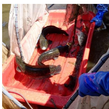
定置網で採れた魚たち ライギョは計7匹採れました