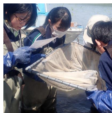
すくうたびに春先に生まれたモツゴなどの稚魚が入りました。