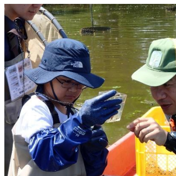
小学生のお子さんも魚に興味深々