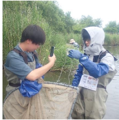
捕獲した小魚を手にパチリ