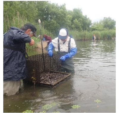
人工産卵床を確認している様子