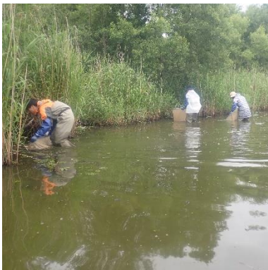
岸に沿って稚魚すくいを実施

バス・マスターズの活動は来年度も継続していく予定です。引き続きよろしくお祈いします。