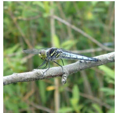
多くのトンボが飛び交う中での作業でした。

本年度のバス・マスターズへ参加いただいた皆様 ご協力まことにありがとうございました。引き続きよろしくお祈いします。