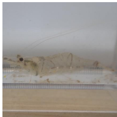
確認されたスジエビ