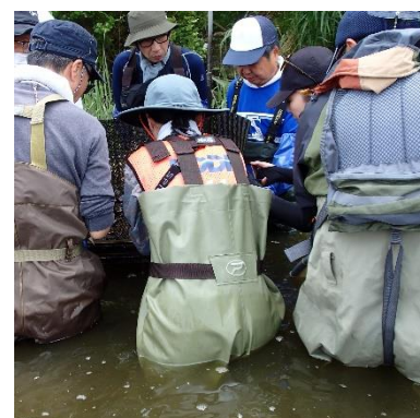
多くの人が卵を確認