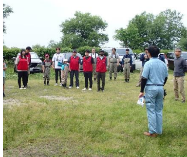
財団から実施内容を説明

陽気にも恵まれ、水温は23.4℃。オオクチバスの産卵床は2ヶ所確認され、バスの稚魚はまだ確認されませんでした。しかし、三角網ではゼニタナゴの稚魚、1回目に続いてスジエビが確認されており在来種の増加がうかがえます。3ヶ所設置した定置網では、モツゴやフナなどの小型魚、ライギョなど大型魚が引き続き確認されました。