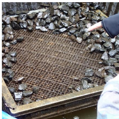
産み付けられたオオクチバスの卵