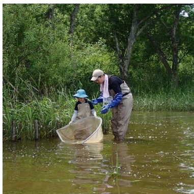
小さいお子さんは浅瀬でトライ