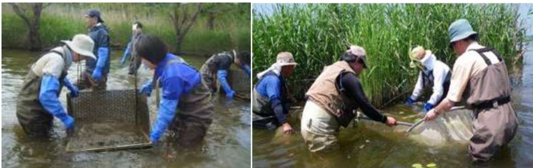
図2 ボランティア団体バス・バスターズによる駆除活動の様子。人工産卵床によるオオクチバスの巣の駆除（左）と、三角網を用いた稚魚の駆除（右）