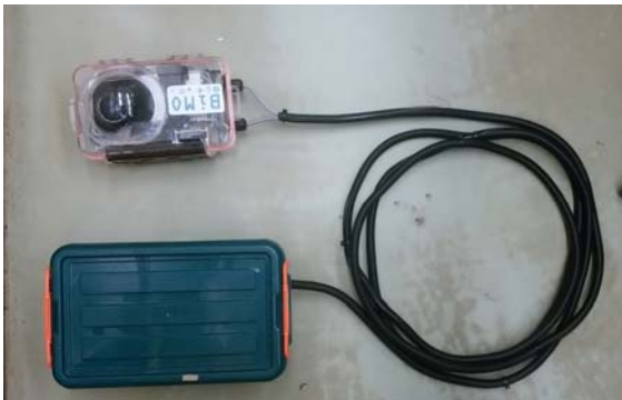
①必要なのはスマホと電源

色んな地域で、誰もが手軽に水中体験&調査ができるツールづくりを目指しています。今回の受賞を機に、今後も研究の発展に取り組んでいきます。