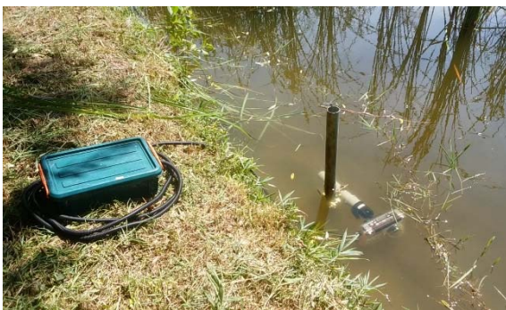
②水辺にセット(水中のスマホから通信しています)