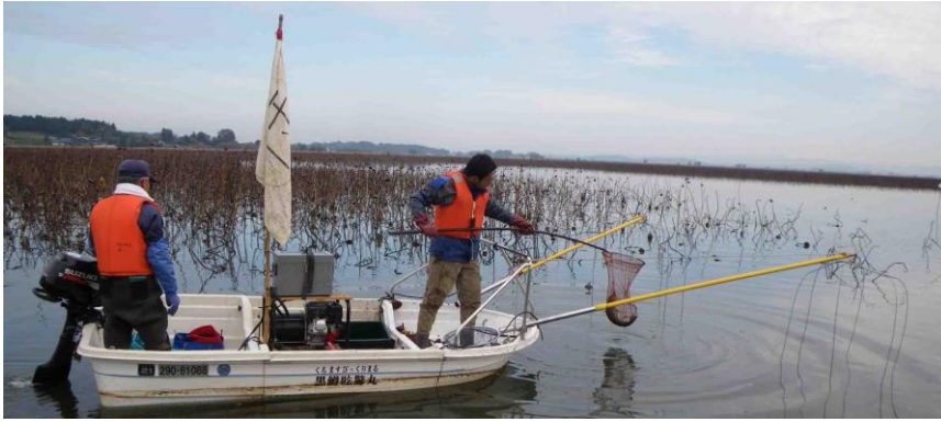
電気ショッカーボートによる駆除風景

伊豆沼・内沼では、4月から6月にかけて、週に2回程度電気ショッカーボートによるバスやブルーギルなどの外来魚駆除活動を行います。これまでの駆除活動によりフナなどの在来魚類の数が回復しつつあります。