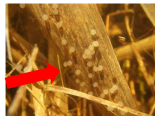
産卵中のフナ(上)とヨシに産み付けられたフナの卵(下)