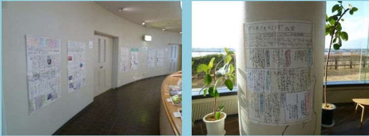
鳥や魚など伊豆沼・内沼の生き物について書かれています。