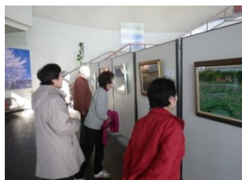
昨年の絵画展の様子