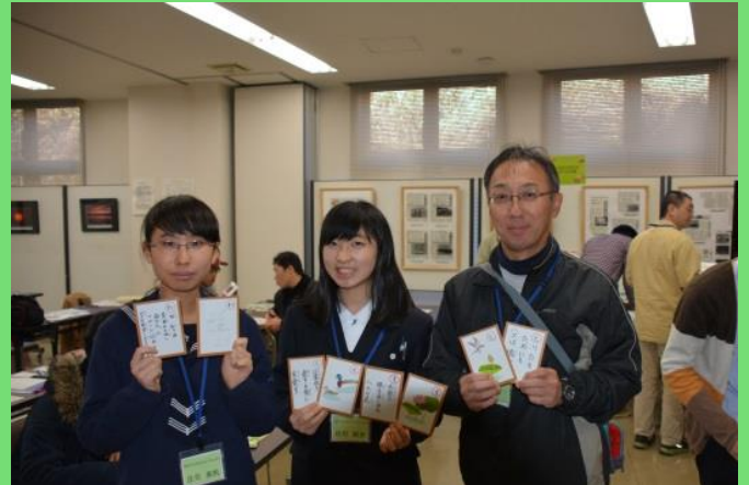
伊豆沼・内沼版かるたの完成です！

宮城県自然保護課による、新しいイベントが12月5日に開催されました！それは「生きものカルタ」づくり。生き物に関するさまざまなカルタを作ることで、「生物多様性」について考えて貰おうという企画です。約20名の方が、栗原市・登米市の生きものを題材に、いろいろなカルタを発表しました。中には、「ほんによ」など農業に関わるカルタもあり、生きものの豊かさ＝生物多様性が私たちの生活を支えていることを体感できる企画になりました。2月には本企画も含めたシンポジウムが仙台で開催されます。