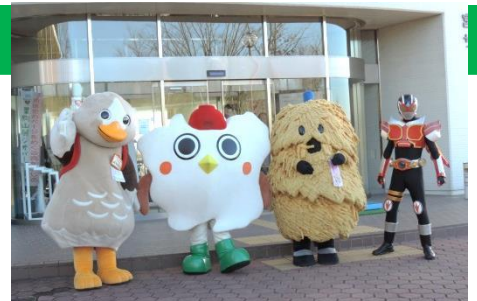
左からパタ崎さん、はっとな、ねじりほんによ、クリハラライザー

11月28日(土)、宮城県伊豆沼・内沼サンクチュアリセンターで、ラムサール条約登録三十周年記念事業「伊豆沼・内沼感謝祭」が開催され、さまざまなイベントを通して、伊豆沼・内沼へ感謝する日となりました。テーマは、ワイズユース(賢明な利用)で、伊豆沼をいろいろ活用しようということです。栗原市や登米市・大崎市のゆるキャラたちにお出迎えしてもらいました。