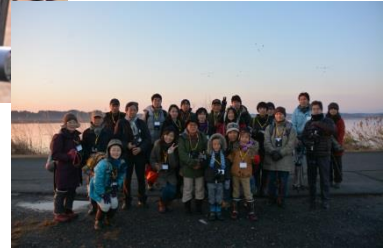
沼をバックにハイ！チーズ！