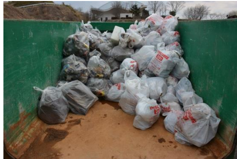
ゴミの量は年々減ってきています。