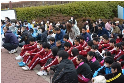
たくさんの方々に参加していただきました！