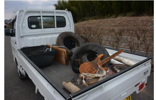
今回も多くの粗大ゴミが沼辺に捨てられていました