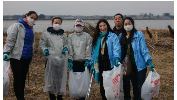
たくさんゴミを拾っていただきました！

今回は3会場で参加者約900人、ゴミの量2.5トンでした。今回は、タイヤやテレビなどの粗大ゴミが多くが沼に捨てられています。