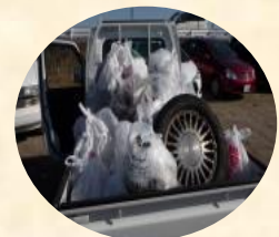
「こんなにゴミがとれました。」