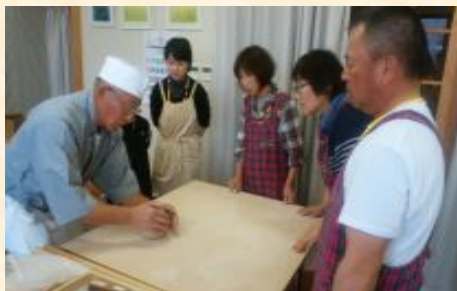
「そば打ちのプロに作り方を習いました。」

食欲の秋。11月の「サンクチュアリ友の会 会員研修」では、そばの名所、山形県大石田市にそば打ち体験に行きました。力を込めてそばを打ち、大きな専用の包丁で麺を切り出しました。自分で作った十割そばは、市販では味わえないモチモチとした独特の食感で、参加者は味と食感を噛みしめながら、深まる山形の秋を堪能しました。