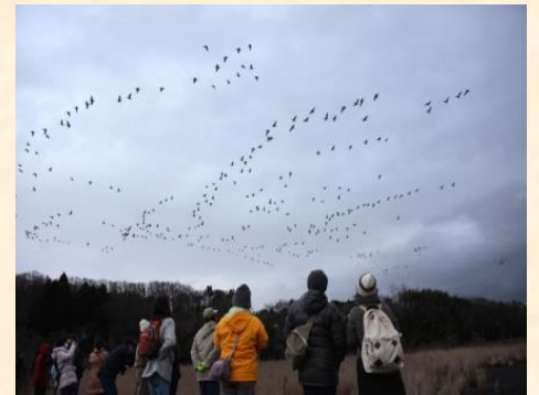
頭上を通過するマガンの群れに歓声があがりました。

12月10日、第9回自然体験講座が開催されました。今回の講座は、早朝にマガンの飛び立ちを観察した後、沼の岸边をのんびりと歩きながら野鳥を探す企画。当日の朝は曇っていて残念ながら朝日はすっきりと出てくれませんでした。飛び立ち自体は当たりの日で、壮観な光景を堪能できました。つづく沼歩きでは、水面に浮かぶおびたしい数のオオハクチョウやオオヒシクイ、電柱からネズミを狙うノスリ、ちよこまかと忙しく動き回るエナガの群れ、池で小魚を捕らえるダイサギなどが見られました。短い時間ながら沼に生きる様々な野鳥に出会うことができ、参加者の皆さんもご満足いただけました。来年度も同様の講座を開催予定です。是非ご参加下さい。