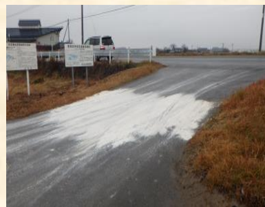
消毒のため、内沼の出入りに撒かれた石灰

http://www.pref.miyagi.jp/soshiki/sizenhogo/innfuruennzakennsatopenterh282.html