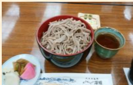
「出来上がった自作のそば。おいしく頂きました。」