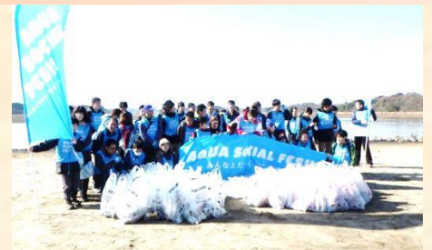
「みんなで集合写真！」

砂浜をヨチヨチ歩くオナガガモの姿に、参加者の皆さんは目を細めていました。皆さまのお陰できれいになった伊豆沼・内沼。生き物や私たちにとって、すこしやすい水辺を目指して、このような活動を今後も応援していきたいと思えます。